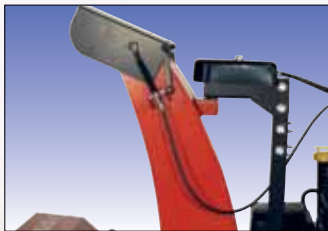
Fernbedienung für Auswurf Télécommande pour l'éjection

Fraises à neige robustes, puissantes et confortables