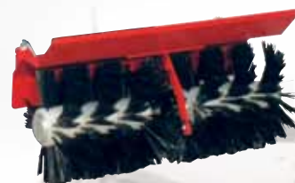
Kehrbesen/Balayeuse 75 cm Fr. 1'180.-

Motor / Moteur Honda GX160 5 PS / cv Gänge / Vitesse 1 Vorwärtsgang / 1 marche avant 2.5 km/h Antrieb / Transmission Zahnradgetriebe, Ölbad / engrenages à bain huile Bereifung / Roues 3.50-6 AS Schnellanschluss / Raccordement rapide für Anbaugeräte / pour les outils Gewicht / Poids ca. 60 kg / environ Abmessung / Dimensions L 120, B 46, H 95 cm