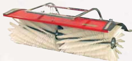
Kehrbesen/Balayeuse 100 cm Fr. 1'480.-

Motor / Moteur Honda GX160 5 PS / cv Gänge / Vitesses 2 Vor- u. 1 Rückwärtsgang / 2 avant, 1 arrière 2.7 / 5.5 km/h Antrieb / Transmission Zahnradgetriebe, Ölbad / engrenages à bain huile Bereifung / Roues 13x5.00-6 Schnellanschluss / Raccordement rapide für Anbaugeräte / pour les outils Gewicht / Poids ca. 76 kg / environ Abmessung / Dimensions L 126, B 51, H 102 cm