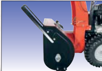
Trennmesser für Schneehöhe bis 70 cm Lame de coupe pour une hauteur de neige jusqu'à 70 cm