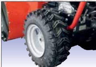
Bereifung ASTER 28i Pneus ASTER 28i